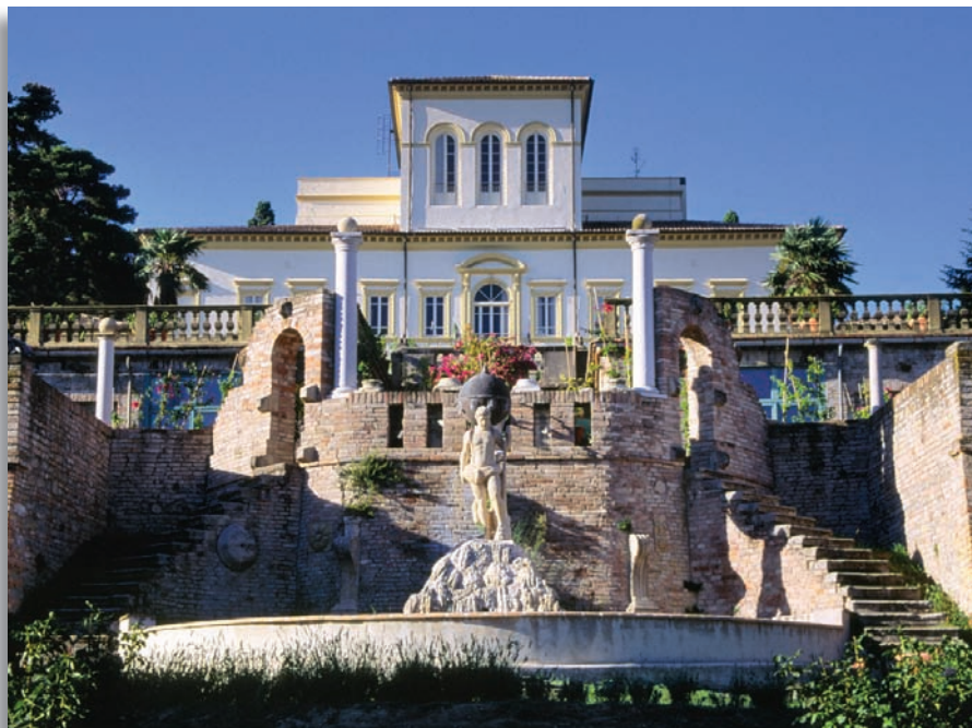
Pesaro - Villa Caprile

Ambulatorio Disturbi Comportamento Alimentare tel. 0721 424781