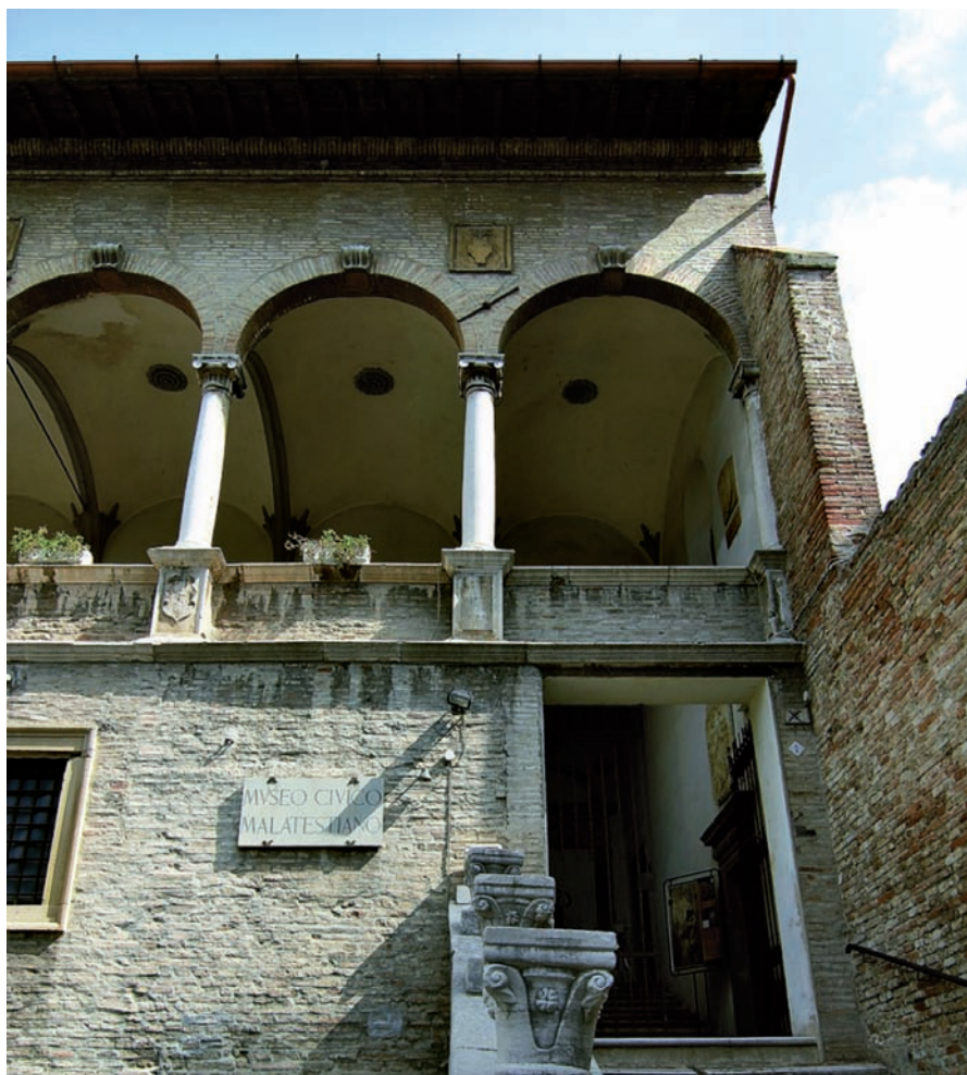
Fano - Loggia Sansovino