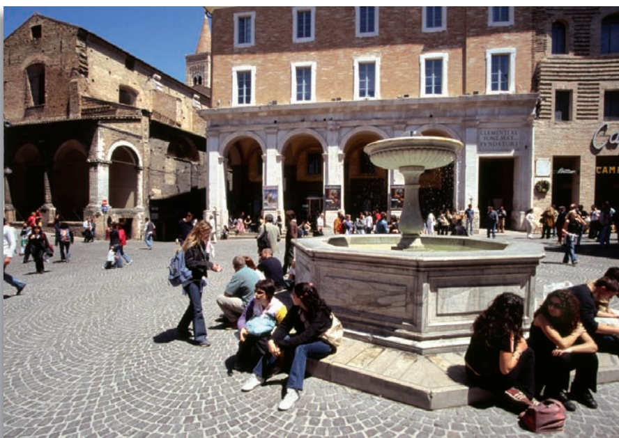
Urbino - Piazza della Repubblica