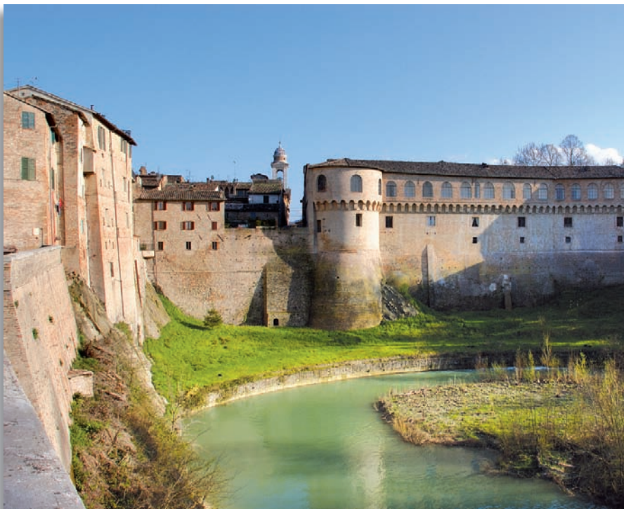
Urbina - Palazzo Ducale

Commissione Medica Patenti Guida tel. 0722 301504