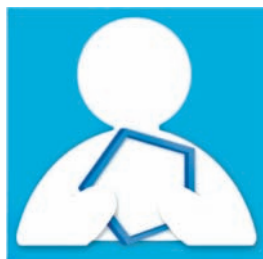
FONDAZIONE Ospedali Riuniti di Ancona